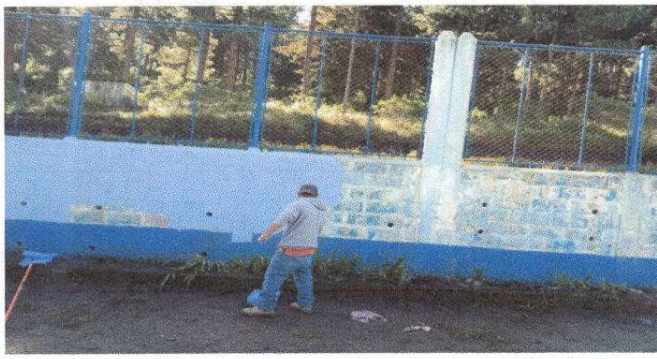
Foto1: Pintura de pared de circulación blok en mal estado.